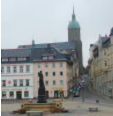
Markt und St.-Annen-Kirche