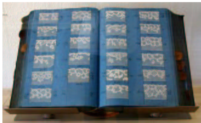
Musterbuch, 19. Jahrhundert, Adam-Ries-Haus

Mit dem Aufblühen der Bergstadt Annaberg durch den Bergbau entstand der Bedarf an textilem Luxus. Die Bergherren und deren Familien stellten mit reich verzierten Kleidern ihren Reichtum zur Schau. Somit entwickelte sich die Herstellung und der Handel von Borten und Klöppelspitzen. Mitte des 16. Jahrhunderts trat eine Krise im erzgebirgischen Bergbau ein, und die Borten- und Klöppelspitzenherstellung erlangte nunmehr eine zunehmende Bedeutung als Wirtschaftsfaktor und Hauptquelle des Broterwerbs. Barbara Uthmann erkannte dies mit unternehmerischer Weitsicht und begann ein Verlagswesen für den Handel mit Bortenerzeugnissen aufzubauen, welches 1550 erstmals urkundlich genannt wurde.