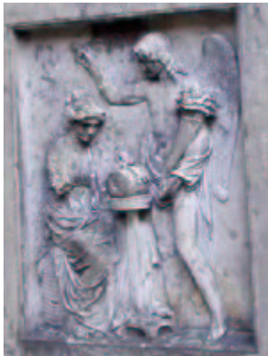
Grabmal im Stadtpark

Die im Spitzenhandel reich gewordene Firma August Eisenstuck stiftete ein Grabmal, welches der Dresdner Bildhauer Franz Seraph Pettrich schuf und das am 17. Oktober 1834 auf dem Trinitatis-Friedhof eingeweiht wurde.