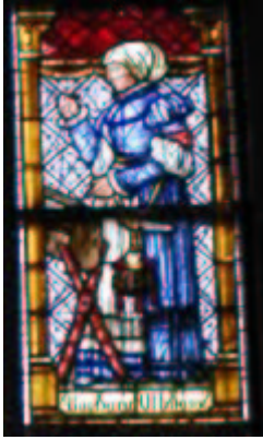
Uthmann-Fenster der St.-Annen- Kirche