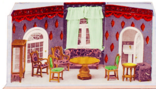
Puppenstube auf historischem Musterblatt

Die Ausstellung bietet eine unterhaltsame Reise in die Vergangenheit der Puppenstuben und Kaufmannsläden und zeigt neben 35 komplett eingerichteten Stuben und Läden aus den letzten 120 Jahren auch die Geschichte der erzgebirgischen Puppenmöbelfabrikation. Kulturgeschichte en miniature könnte man sagen, wenn da über 50 Möbelsortimente den Stilwandel vom Biedermeier bis hin zum "Nierentisch" der 50er Jahre nachvollziehen lassen. Viele der früher in Kistchen oder Kartons eingehafteten Kostbarkeiten imitierten edle Hölzer und Furniere. Auch Spielzeugküchen inklusive mannigfaltiger Blechherde, in der Regel mit Spiritusheizung, dürften das Besucherherz höher schlagen lassen. Der Bogen wird bis hin zur Gegenwart gespannt, wenn Puppenhäuser und Spielmöbel der letzten Jahre einen Blick auf die neusten Entwicklungen gestatten. Attraktion in der Schau sind die originalen Musterblätter und Warenkataloge einstiger Hersteller.