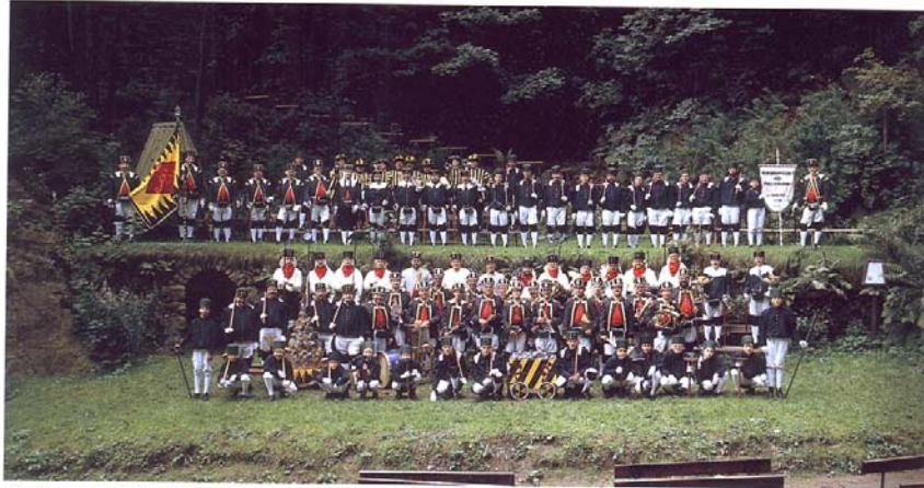
Mitglieder der Seiffener Knappschaft in der Binge / Členové seiffenského tovaryšstva v opuštěné stole

Seiffen erlebte mehrere unterschiedlich intensive Bergbauperioden. Ein letzter Höhepunkt war im Jahre 1725 mit einem Ertrag von 400 Ztr. Zinn erreicht. Danach setzte der allmähliche Rückgang ein. Die jahrhundertalte Existenzgrundlage der Bevölkerung verlor an Bedeutung. In zunehmendem Maße bestimmte das Holzverarbeitende Gewerbe die wirtschaftliche Struktur. Daraus entwickelte sich im Verlauf der Zeit die heute weltberühmte Herstellung von Holz-