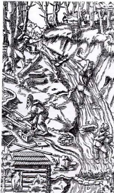
Arbeiten in einer Zinnseife (nach G. Agricola 1556) Práce v rýžovně cínu (podle J. Agricoli 1556)

spielzeug. Der Bergmann als Träger der Traditionen der Seiffener Volkskunst steht dabei im Mittelpunkt. Das bergbauliche Erbe ist in Seiffen noch überall gegenwärtig. Ein 1987 angelegter „Historischer Bergbaustieg“ führt zu bemerkenswerten Zeugnissen des einstigen Bergbaugeschehens, so auch den eindrucksvollen Bingen und der 1776 – 1779 erbauten Bergkirche, dem Wahrzeichen des Ortes. Seit 1991 gibt es die Berg- und Hüttenknappschaft Seiffen.